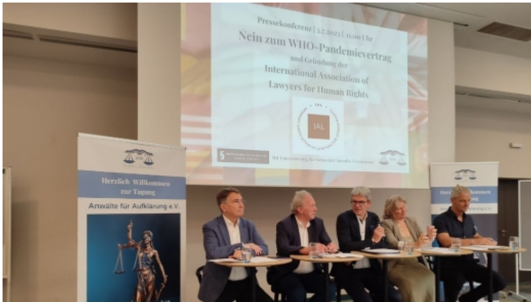
Pressekonzferenz zum Internationalen Anwaltskongress, Köln, 3.07.2023